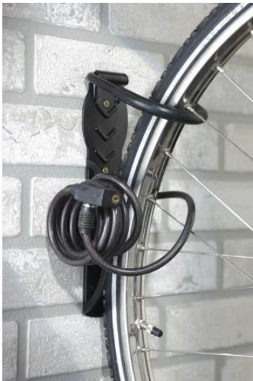
Crochet vélo mural Mottez B865V

Ces fixations optimisent la place mais ne permettent pas forcément de sécuriser chaque vélo individuellement à l'aide d'un câble/cadenas, contrairement à celles-ci :