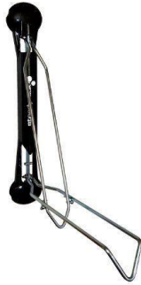
Steadyrack – fixation murale – possibilité d’y greffer un anti-vol